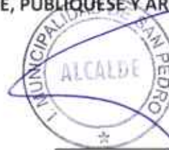
EMILIO CERDA SAGURIE ALCALDE

ECS/MMM/GMG/ELM/LSP/CCD/CBR/cbr DISTRIBUCIÓN: